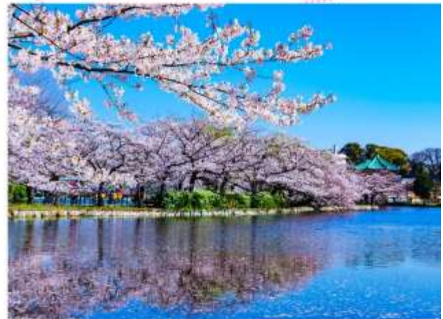
ริบประทาบอาหารกลางวัน ณ กิตตาคาร