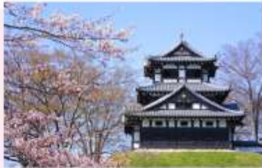
TAKADA CASTLE SITE PARK