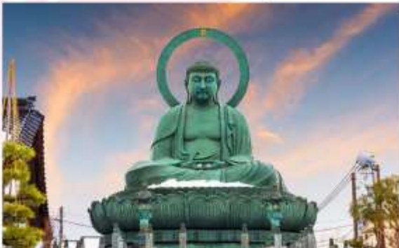
TAKAOKA GREAT BUDDHA

ขอพร “พระใหญ่ทาคาโอกะ หรือ ทาคาโอกะโคบุตสึ” เป็นหนึ่งในพระพุทธรูปทองสัมฤทธิ์ที่ใหญ่และสวยงามที่สุดในญี่ปุ่น ตั้งอยู่ในเมืองทาคาโอกะ พระพุทธรูปองค์นี้มีความสูงถึง 16 เมตร สร้างจากทองสัมฤทธิ์ที่ผลิตในท้องถิ่น และใช้เวลาสร้างนานถึง 26 ปี