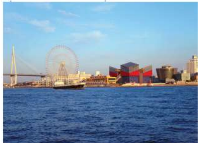
VISIT TEMPOZAN MARKET PLACE