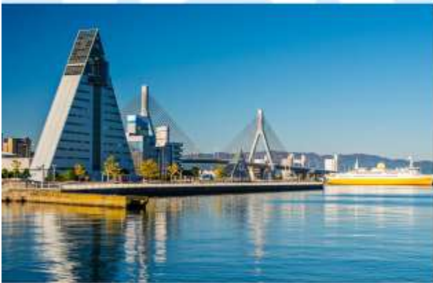
TRNF TO AOMORI