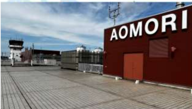
TRNF TO AOMORI AIRPORT/FLY TO ITAMI AIRPORT

เดินทางสู่ "สนามบินอาโอโมริ" ออกเดินทางสู่ "สนามบินอิตามิ" โดยสายการบินเจแปนแอร์ไลน์ เที่ยวบินที่ JL 2154 (13.55 น.-15.35 น.)