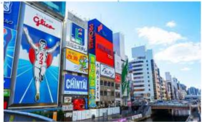
SHOPPING AT SHINSAIBASHI

"โรงงานชิกิกะโช" ชมมินิจู รสนม ของฝากสุดคลาสสิกจากโอซาก้า มีขนมหวานมากกว่า 100 ชนิด รวมถึงขนมและเค้กญี่ปุ่น ท่านสามารถเพลิดเพลินกับการช้อปปิ้งขนมหวานได้ตามใจชอบ