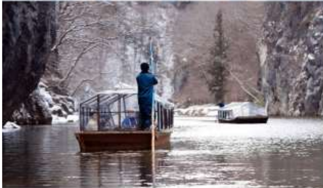
VISIT GEIBIKEI GEORGE