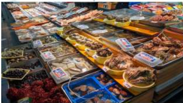
VISIT HASSHOKU CENTER

ตลาดปลา “อิชโชคุ เซ็นเตอร์” เป็นตลาดอาหารทะเลขนาดใหญ่ มีร้านค้ากว่า 60 ร้านเรียงรายกันเต็มไปหมด อาทิ อาหารทะเลสดๆ ผักผลไม้ และของฝากมากมาย ท่านสามารถเลือกซื้อวัตถุดิบที่ชอบไปปรุงอาหารเอง หรือจะเลือกซื้ออาหารทะเลที่ปรุงสุกแล้วก็ได้ ทำให้ท่านรู้สึกได้ลิ้มลองรสชาติความสดหวานของอาหารทะเลอย่างแท้จริง