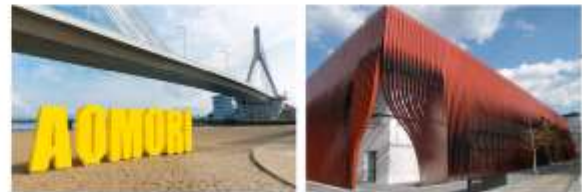
อิสระอาหารกลางวัน ณ กิตตาคาร

"A-FACTORY" แหล่งรวมสินค้าและประสบการณ์สุดพิเศษ ตัวอาคารมีดีไซน์ทันสมัย ตั้งอยู่ริมทะเล ทำให้มีวิวที่สวยงาม เหมาะแก่การพักผ่อนและถ่ายรูป ตลาดขนาดใหญ่ที่รวบรวมสินค้าท้องถิ่นหลากหลายชนิด โดยเฉพาะอย่างยิ่ง ผลิตภัณฑ์จากแอปเปิ้ล ซึ่งเป็นผลไม้ขึ้นชื่อของจังหวัดอาโอโมริ