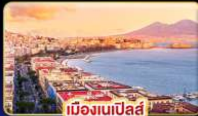
เมืองเนเปิลส์