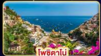
โพซิตาโน