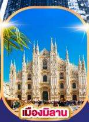
เมืองมิลาน