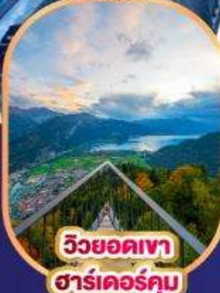
วิวยอดเขา ชาร์เตอร์คัม