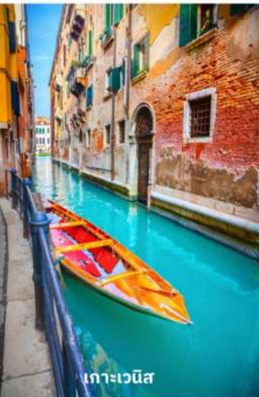
เกาะเวนิส

เพื่อเตรียมตัวนั่งเรือข้ามสู่เกาะเวนิส เกาะเวนิสเป็นดินแดนแสนโรแมนติก เป็นเมืองที่ไม่เหมือนใคร โดยใช้เรือแทนรถ ใช้คลองแทนถนน มีสมญานามว่าเป็น “ราชินีแห่งทะเลเอเดรียติก” มีเกาะน้อยใหญ่กว่า 118 เกาะและมีสะพานเชื่อมถึงกันกว่า 400 แห่ง