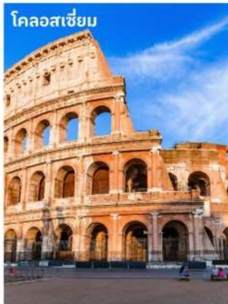
โคลอสเซียม