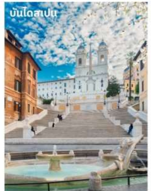
บันไดสเปน