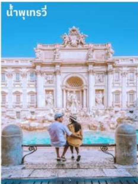
น้ำพุเทรวี

จากนั้นอิสระตามอัธยาศัยกับการเลือกซื้อสินค้าแฟชั่นและของที่ระลึกในบริเวณย่าน บันไดสเปน (The Spanish Step) ซึ่งเป็นแหล่งแฟชั่นชั้นนำสุดหรูและยังเป็นแหล่งนัดพบของชาวอิตาเลียน