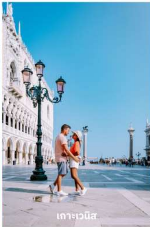
เกาะเวนิส