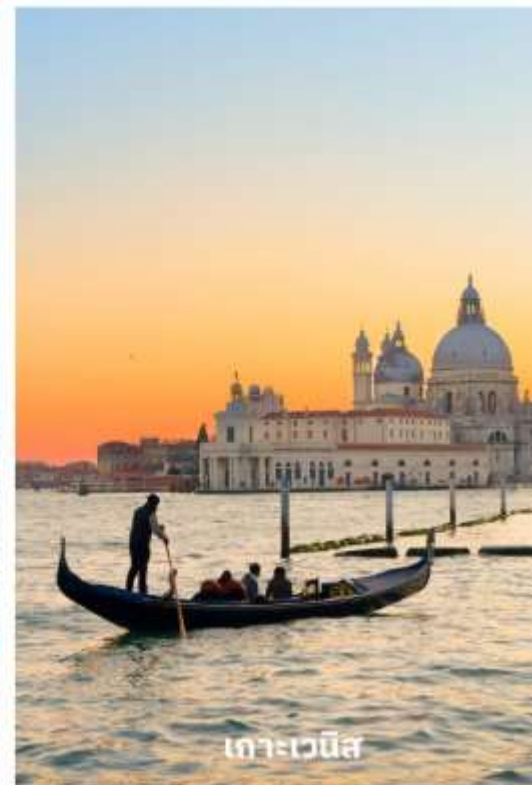
เกาะเวนิส

นำทุกท่านนั่งเรือต่อเพื่อไปยัง ท่าเรือซานมาร์โค (San Marco Pier) บนเกาะเวนิส แวะให้ท่านถ่ายรูปสวยๆ เก็บเป็นที่ระลึกกันที่ พระราชวังดอดจ์ พระราชวังริมน้ำแสนอลังการ ที่สร้างตั้งแต่ศตวรรษที่ 14 ในสไตล์เวเนเซียนโกธิค ที่เคยเป็นที่ประทับของผู้ปกครองของเวนิส แต่ตั้งแต่ปี 1923 ก็ได้เปลี่ยนเป็นพิพิธภัณฑ์ให้คนทั่วไปได้เข้าชม เป็นหนึ่งในแลนด์มาร์กหลักของเวนิส จากนั้นเดินเที่ยวชมแลนด์มาร์คสำคัญต่างๆ ในเมือง จัตุรัสเซนต์มาร์ค เป็นจัตุรัสหลักของเมืองเวนิส และยังเป็นศูนย์กลางเมืองตั้งแต่โบราณ จากนั้นนำท่านถ่ายรูปกับ มหาวิหารเซนต์มาร์ค มหาวิหาร ใหญ่ของศาสนาคริสต์นิกายโรมันคาทอลิก อลังการด้วยการตกแต่งด้วยโดมใหญ่ และที่อยู่ติดกันและโดดเด่นด้วยความสูงถึง 50 เมตรก็คือ หอรบขัง ถือเป็นหนึ่งในสัญลักษณ์ของ เมืองที่เห็นได้ไม่ว่าจะอยู่มุมไหนของเมืองก็ตาม และที่พลาดไม่ได้เลยก็คือ สะพานถอนหายใจ สะพานอันโด่งดังแห่งนี้ตั้งอยู่เหนือแม่น้ำที่คั่นกลางระหว่างคูเก่ากับพระราชวังดอดจ์