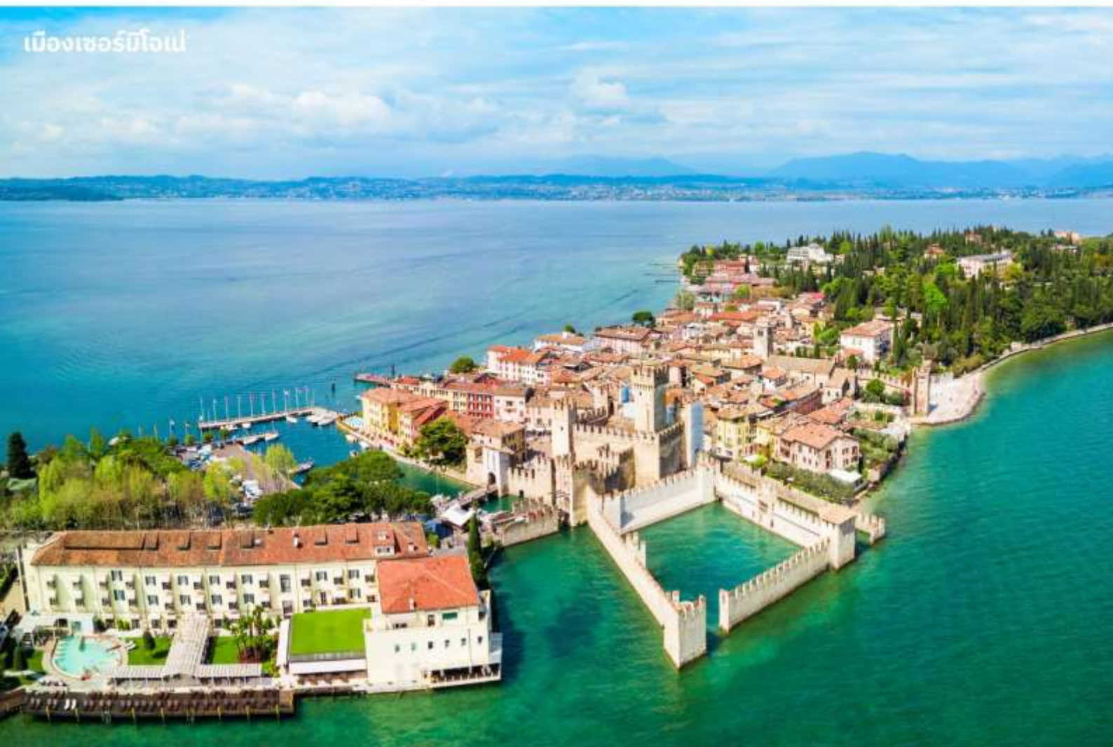
เมืองเซอร์มิโอเน่

บริการอาหารค่ำ ณ ภัตตาคาร นำท่านเข้าสู่ที่พัก IH Hotels Milano Lorenteggio หรือเทียบเท่า