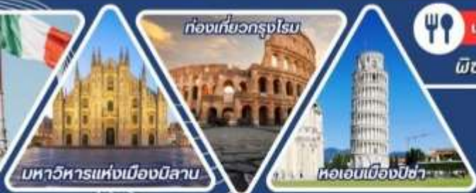
มหาวิหารแห่งเมืองมิลาน

นั่งรถไฟเที่ยวซิงเควเทอร์ เที่ยวเกาะเวนิส หอเอนพิซ่า ใน 7 สิ่งมหัศจรรย์