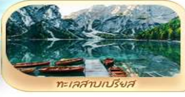
ทะเลสาบปรีงส์