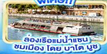
ล่องเรือแม่น้ำแซน ชมเมือง โดย บาโต บูช