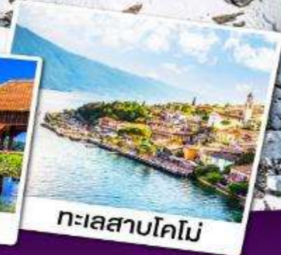
ทะเลสาบโคโม