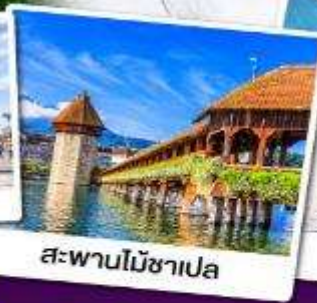
สะพานไม้อาเปลา