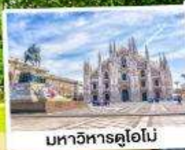
มหาวิหารดูโอโม