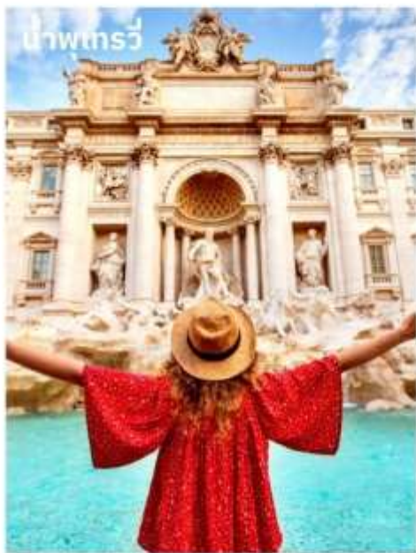
น้ำพุเทรวี

จากนั้นอิสระตามอัธยาศัยกับการเลือกซื้อสินค้าแฟชั่นและของที่ระลึกในบริเวณย่าน บันไดสเปน (The Spanish Step) ซึ่งเป็นแหล่งแฟชั่นชั้นนำสุดหรูและยังเป็นแหล่งนัดพบของชาวอิตาเลียน