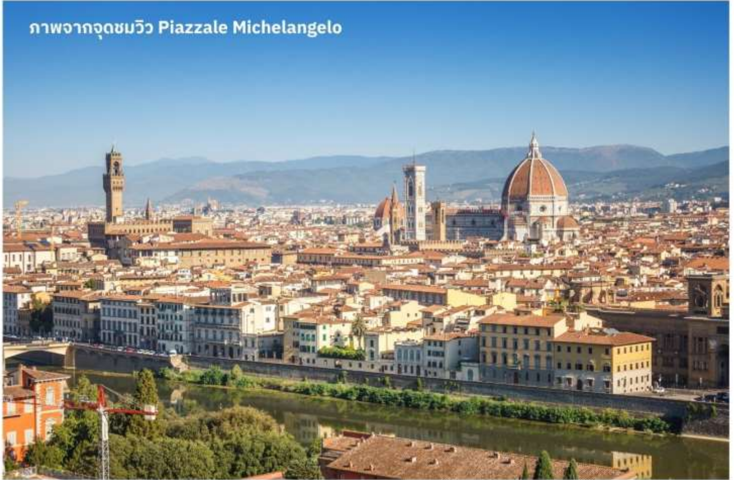
ภาพจากจุดชมวิว Piazzale Michelangelo

เมืองฟลอเรนซ์ ตั้งอยู่ทางตอนเหนือของประเทศอิตาลี เป็นเมืองที่มีชื่อเสียงในช่วงศตวรรษที่ 13-14 ซึ่งเป็นยุคที่เจริญรุ่งเรืองของวัฒนธรรมและศิลปะ อีกทั้งในอดีตยังมีความสำคัญทางการค้าและวัฒนธรรม มีสถาปัตยกรรมที่งดงามและเป็นที่มาของศิลปะโรแมนติกที่เจริญรุ่งเรืองอย่างมากในยุคนั้น นำท่านเดินทางไปยังเนินเขา Piazzale Michelangelo เพื่อชมวิวของเมือง Florence ที่นักท่องเที่ยวรวมไปถึงชาว Florence เอง มักขึ้นมาชมบรรยากาศในมุมสูงของเมือง ซึ่งจะเห็นหลังคาสีแดงของอาคารบ้านเรือนต่างๆ รวมไปถึง Duomo เรียงรายกันเป็นแนวสวยงามยิ่งนัก อีสาระให้ท่านเก็บภาพประทับใจตามอัธยาศัย