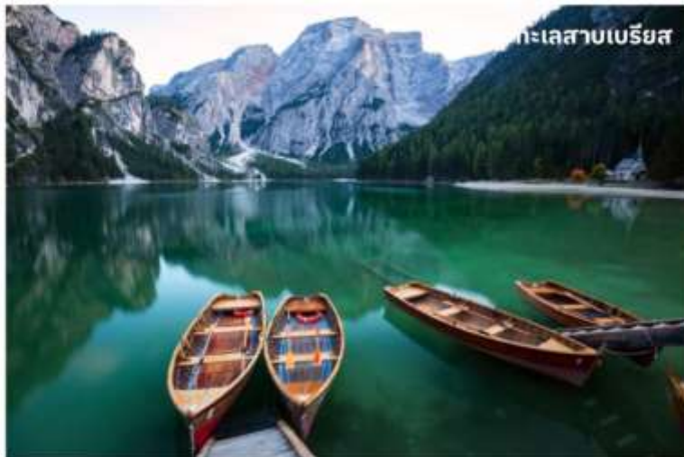
ทะเลสาบเบรียส