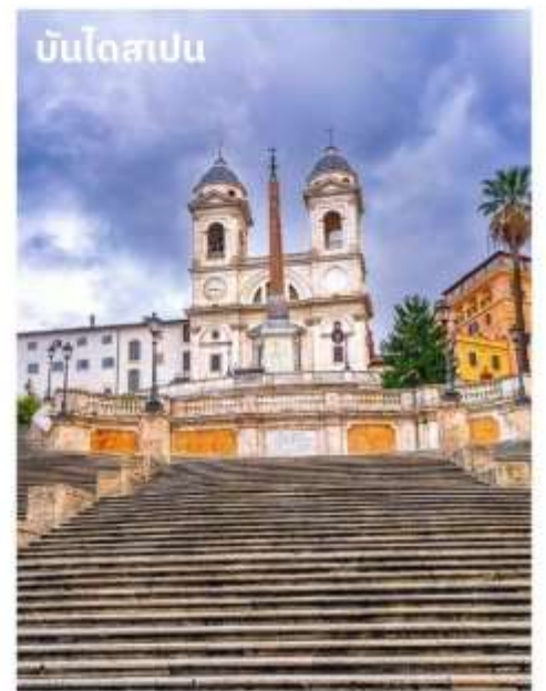
บันไดสเปน