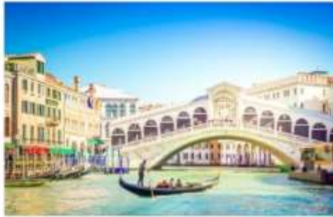
สะพานรีอัลโต