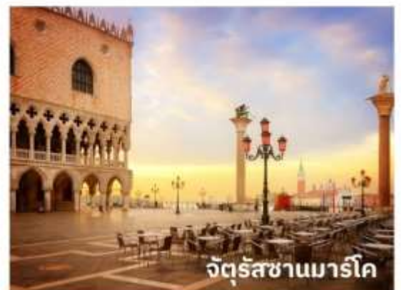
จัตุรัสซานมาร์โค

ท่านสามารถทำการสแกน QR CODE นี้ เพื่อรับชม เกาะเวนิส ในรูปแบบวิดีโอ