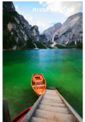
ทะเลสาบเบรียส