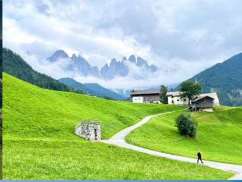
Santa Maddalena - Val di Funes