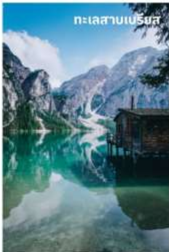
ทะเลสาบเบรียส

บริการอาหารกลางวัน ณ ภัตตาคาร นำท่านเดินทางสู่ ทะเลสาบเบรียส (Lake Braies) หรือ (Pragser Wildsee) ใช้เวลาเดินทางประมาณ 40 นาที เป็นทะเลสาบที่ได้ขึ้นชื่อว่าไข่มุกแห่งโดโลไมท์ ตั้งอยู่ในหุบเขาโดโลไมท์และยังได้เป็นส่วนหนึ่งในมรดกโลก (Unseco) อีกด้วย