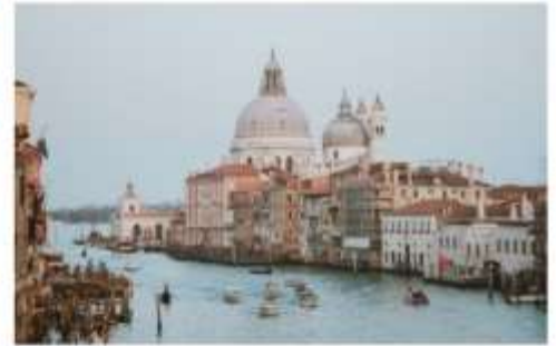
แกรนด์คาแนล

นำทุกท่านนั่งเรือต่อเพื่อไปยัง ท่าเรือซานมาร์โค (San Marco Pier) บนเกาะเวนิส แวะให้ท่านถ่ายรูปสวยๆ เก็บเป็นที่ระลึกกันที่ พระราชวังดอดจ์ พระราชวังริมน้ำแสนอลังการ ที่สร้างตั้งแต่ศตวรรษที่ 14 ในสไตล์เวเนเซียนโกธิค ที่เคยเป็นที่ประทับของผู้ปกครองของเวนิส แต่ตั้งแต่ปี 1923 ก็ได้เปลี่ยนเป็นพิพิธภัณฑ์ให้คนทั่วไปได้เข้าชม เป็นหนึ่งในแลนด์มาร์กหลักของเวนิส จากนั้นเดินเที่ยวชมแลนด์มาร์คสำคัญต่างๆ ในเมือง จัตุรัสเซนต์มาร์ค เป็นจัตุรัสหลักของเมืองเวนิส และยังเป็นศูนย์กลางเมืองตั้งแต่โบราณ จากนั้นนำท่านถ่ายรูปกับ มหาวิหารเซนต์มาร์ค มหาวิหารใหญ่ ของศาสนาคริสต์นิกายโรมันคาทอลิก อลังการด้วยการตกแต่งด้วยโดมใหญ่ และที่อยู่ติดกันและโดดเด่นด้วยความสูงถึง 50 เมตรก็คือ หอรบั้ง ถือเป็นหนึ่งในสัญลักษณ์ของเมืองที่ เห็นได้ไม่ว่าจะอยู่มุมไหนของเมืองก็ตาม และที่พลาดไม่ได้เลยก็คือ สะพานถอนหายใจ สะพานอันโด่งดังแห่งนี้ตั้งอยู่เหนือแม่น้ำที่คั่นกลางระหว่างคุยก่อกับพระราชวังดอดจ์