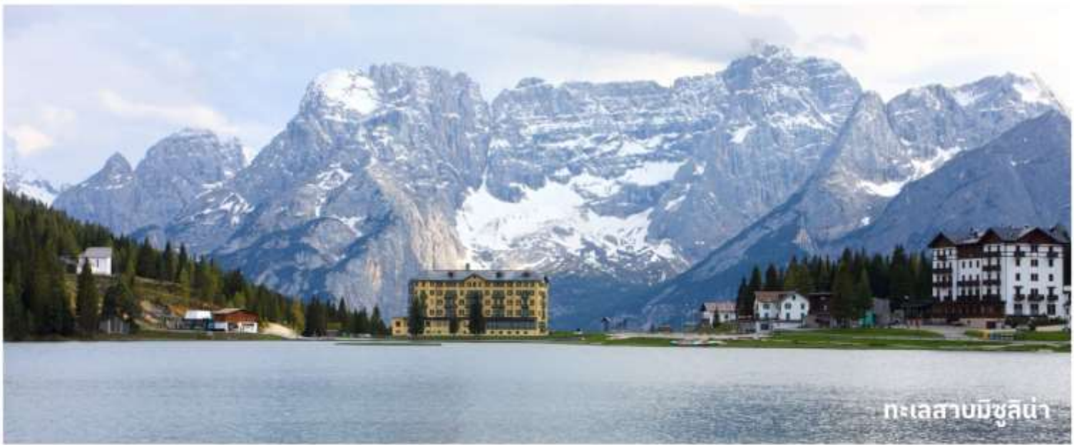
ทะเลสาบมิซูลิน่า

นำท่านเดินทางสู่ที่ ทะเลสาบมิซูลิน่า (MISURINA LAKE) ถ่ายรูปกับทะเลสาบที่สวยงามและเป็นเหมือนกับหนึ่งในแลนด์มาร์คที่นักท่องเที่ยวต้องมาเยือนสักครั้งหนึ่ง เป็นทะเลสาบที่หลบซ่อนตัวในหุบเขา ที่ถือเป็นสถานที่ท่องเที่ยวที่สำคัญอีกแห่งในโดโลไมท์