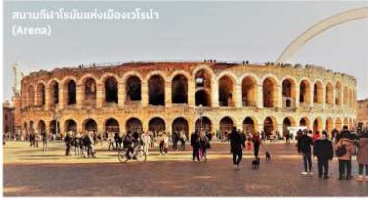
สนามกีฬาโรมันแห่งเมืองเวโรนา (Arena)