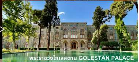
พระราชวังโกเลสถาน GOLESTAN PALACE