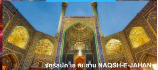
จัตุรัสบิก ไอ ฉะฮาน NAQSH-E-JAHAN