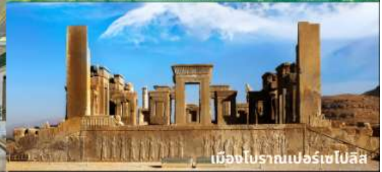
เมืองโบราณเปอร์เซโปลิส