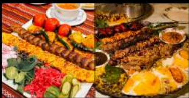
อาหารท้องถิ่นอิหร่านสุดพิเศษ