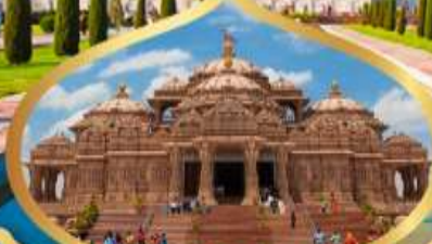
วิหารอักชาร์ตัม