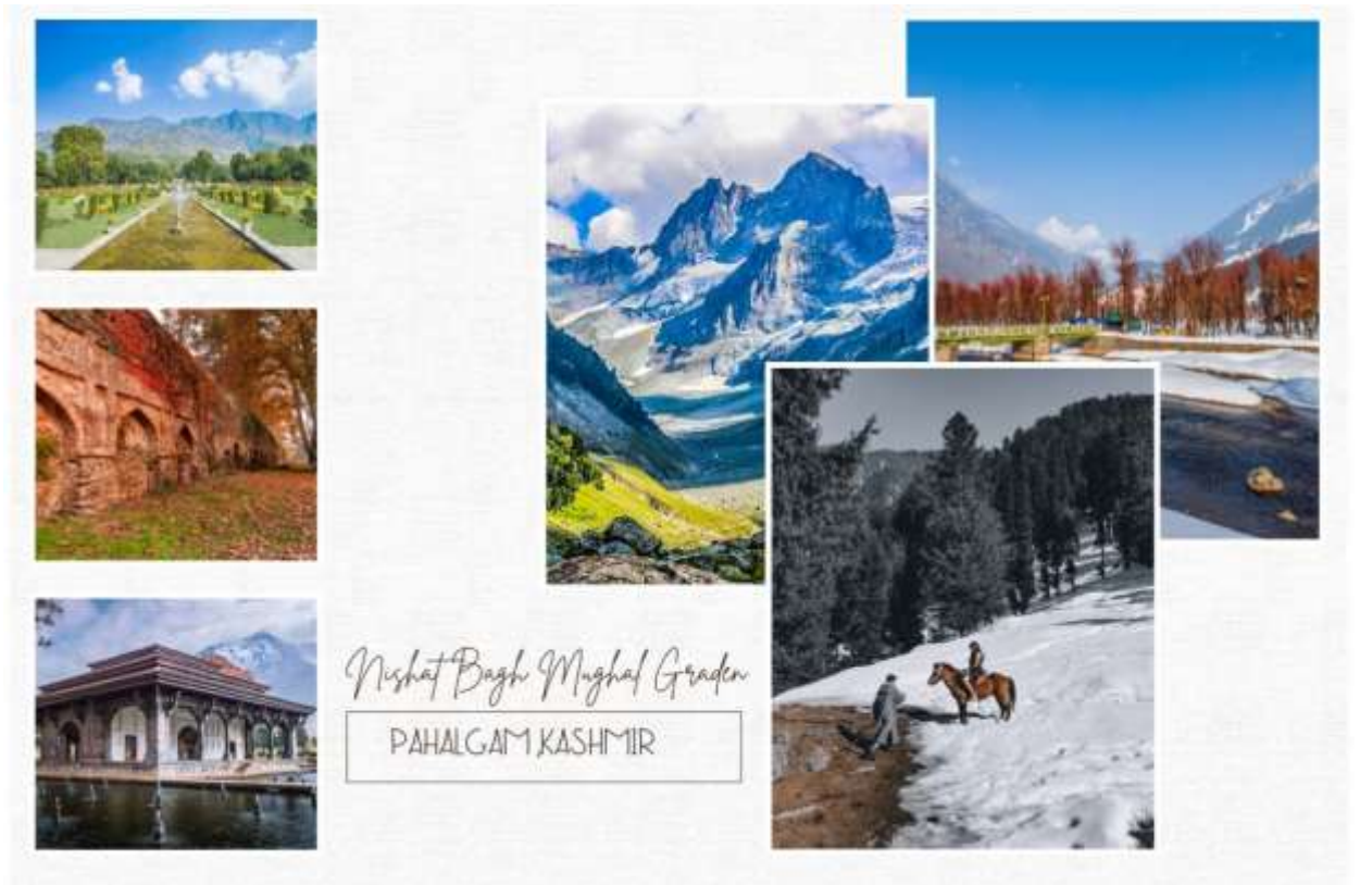
Nisbat Bagh Mughal Garden PAHALGAM KASHMIR

นำท่าน ชม สวนชาลิมาร์ ที่สร้างขึ้นสมัยราชวงศ์โมกุลในเมืองศรีนาคา แคชเมียร์เป็น แคว้นที่มีชื่อเสียงในการจัดสวนตามแบบสมัยของราชวงศ์โมกุล เนื่องจากภูมิอากาศเย็นเหมาะสมในการเจริญเติบโตของต้นไม้ดอกไม้ จึงกลายเป็นที่ประทับพักผ่อนของกษัตริย์ราชวงศ์โมกุลในอดีต สวนชาลิมาร์แห่งนี้เป็นส่วนแห่งความรักสร้างโดยจักรพรรดิชาฮังคี น้ำพุภายในสวนเกิดขึ้นได้โดยแรงดันน้ำธรรมชาติที่มาจากภูเขา ในช่วงฤดูร้อนท่านจะได้พบกับดอกไม้บานาพรรณ รวมทั้งต้นซีนาร์ (ชื่อต้นไม้ที่เรียกตามท้องถิ่น) หรือ ต้นเมเปิ้ล ขนาดใหญ่ในสวนแห่งนี้ บางต้นมีอายุกว่า 300-400 ปี จากนั้นชม สวนนิซาน ตั้งอยู่บนฝั่งของทะเลสาบดาล มีภูเขาซาร์บาวาลตั้งเป็นฉากหลัง เป็นสวนที่ใหญ่ที่สุด มีต้นเมเปิ้ลอายุกว่า 400 ปี รวมถึงดอกไม้สวรรค์ ที่หาพบเห็นได้ยาก และดอกไม้บานาชนิดตามฤดูกาล ตัดไม้กับบรรยากาศยามพระอาทิตย์ตกดิน และหนุ่มสาวแคชเมียร์ที่มักใช้สถานที่แห่งนี้เป็นที่นัดหมาย