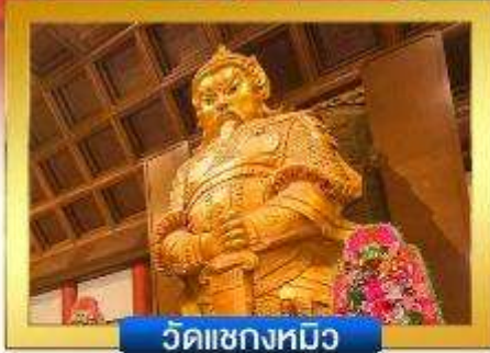
วัดเซ่งก้ง

📍 อิสระช้อปปิ้งย่านจิมซาจู้ & คอสเวย์เบย์