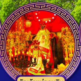
วัดเจ้าแม่กวนอิม ย่องฮ่า