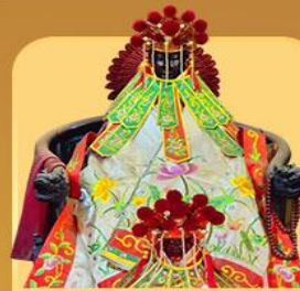
เจ้าแม่กวนอิมสองขำ