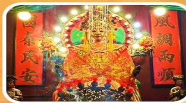
วัดเจ้าแม่กวนอิมเทียนหัว