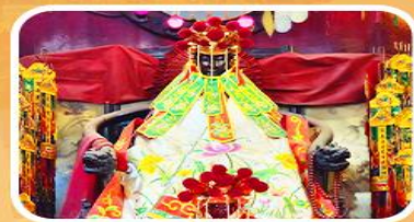
วัดเจ้าแม่กวนอิมสองอ่ำ