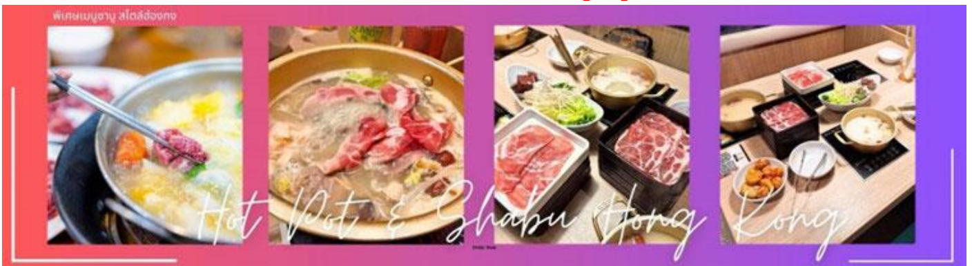
Hot Pot & Shabu Hong Kong

กลางวัน |๐| บริการอาหารกลางวัน ณ ภัตตาคาร .....พิเศษเมนูชาบู สไตล์ฮ่องกง..... (4)