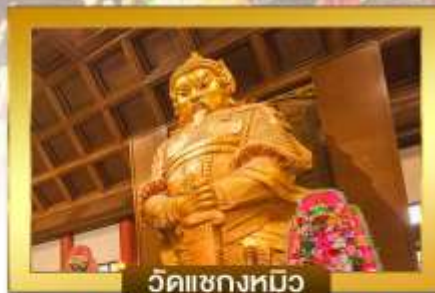
วัดแซงหมิว