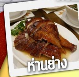
ค่านย่าง