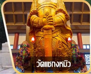
วัดเขกทงหิว