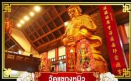
วัดแซงทิว