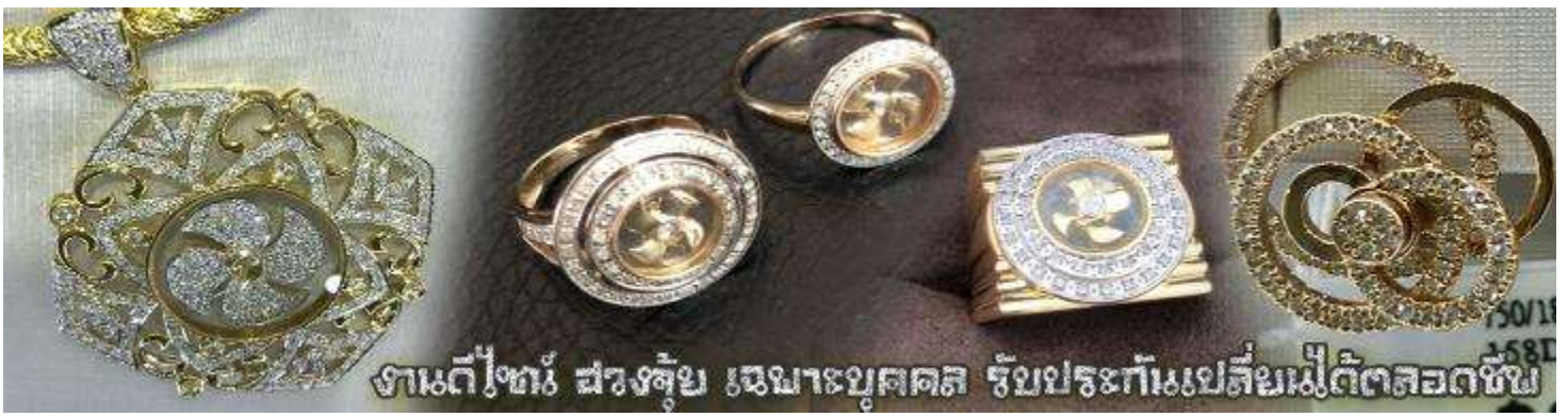
งานตีทองคำ สว่างซึ้ง เหมาะบุคคล รัชประทีปเปลี่ยนเมื่อดีตลอดชีพ

เครื่องรางที่นิยมสวมใส่อยู่ในปัจจุบัน ซึ่งบางท่านอาจจะกำลังมองหาเพื่อนำมาเป็นของฝากให้กับบุคคลที่ท่านรักหรือนับถือ หรือท่านที่กำลังมองหางานของขวัญดี ๆ สักชิ้นเพื่อเสริมดวง แก้ปีชง ปิดเป่าสิ่งชั่วร้าย เรามีบริการแนะนำ อีกมากมาย หลากหลายรายการ ซึ่งหัวหน้าทัวร์และไกด์ท้องถิ่นจะคอยอำนวยความสะดวกในการให้รายละเอียดกับคุณลูกค้า ณ วันเดินทาง