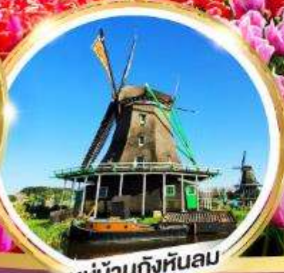
หมู่บ้านกังหันลม