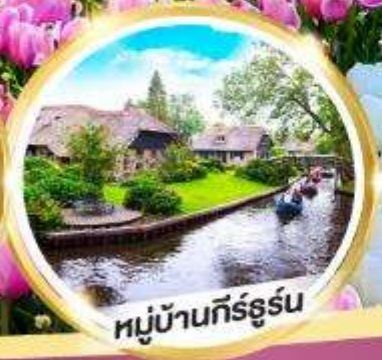
หมู่บ้านกิร์ธูร์น