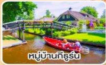
หมู่บ้านกังหัน