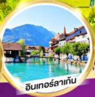
อันเทอร์ลาเกิน