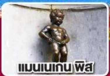
แมนเนเกน ฟิส