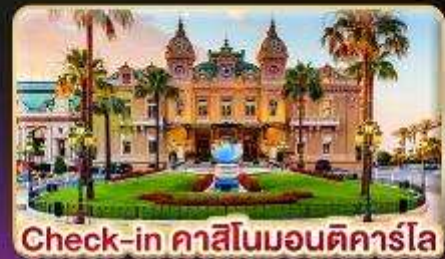
Check-in คาสีโนมอนติคาร์โล