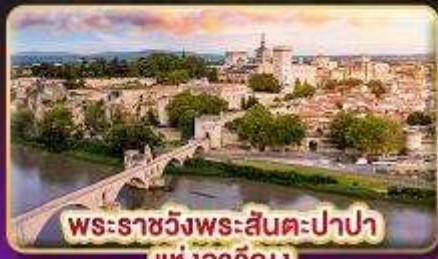
พระราชวังพระสันตะปาปา แห่งอเวญูง