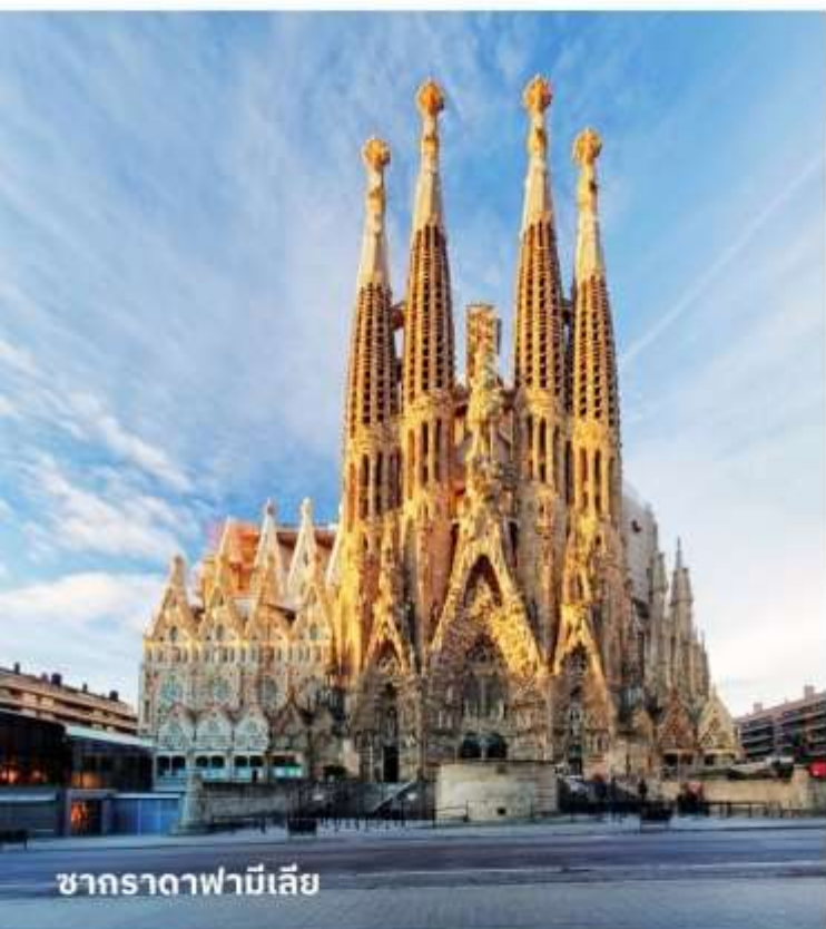
ซากราดาฟามีเลีย