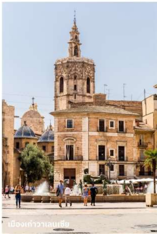
เมืองเก่าวาเลนเซีย