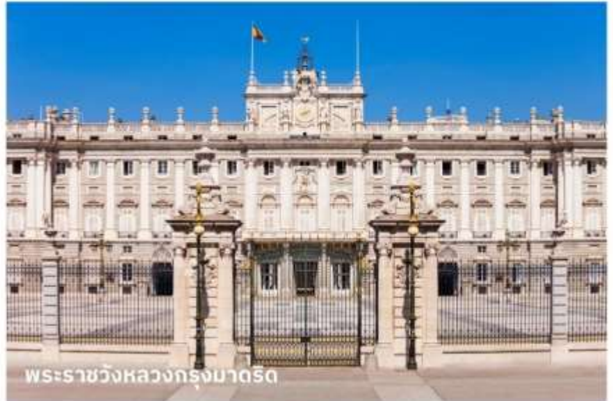
พระราชวังหลวงกรุงมาดริด

บริการอาหารกลางวัน ณ ภัตตาคาร จากนั้นนำท่านเข้าชม พระราชวังหลวงแห่งสเปน แห่งกษัตริย์ฮวน คาร์ลอส มีความสวยงามโอ่อ่าอลังการไม่แพ้พระราชวังอื่นๆ ในทวีปยุโรป เนื่องจากแนวความคิดเปรียบเทียบความใหญ่โตของพระราชวังแวร์ซายส์ และความสวยงามของพระราชวังลูฟว์ ในฝรั่งเศส ตั้งอยู่บนเนินเขาริมฝั่งแม่น้ำแมนซานาเรส