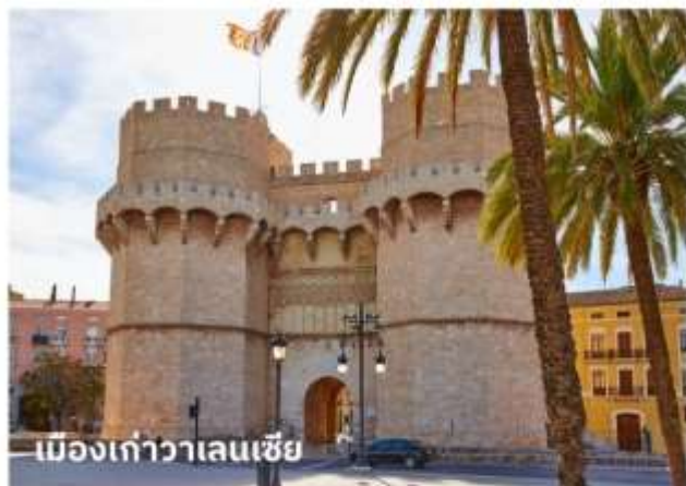
เมืองเก่าวาเลนเซีย

จากนั้นนำท่านเที่ยวชม ย่านใจกลางจัตุรัสเมืองเก่า ซึ่งเป็นที่ตั้งของศาลากลาง, ที่ทำการไปรษณีย์, ร้านค้า, สนามสู่วัวกระทิง นำท่านถ่ายรูปกับ มหาวิหารวาเลนเซีย หรือ มหาวิหารซานตามาเรียแห่งวาเลนเซีย (Catedral de Santa Maria de Valencia) มหาวิหารที่ตั้งอยู่บริเวณใจกลางเมืองเก่า สร้างขึ้นในสไตล์ผสมผสานอาทิ โกรธิค, นีโอคลาสสิก, บาร็อก