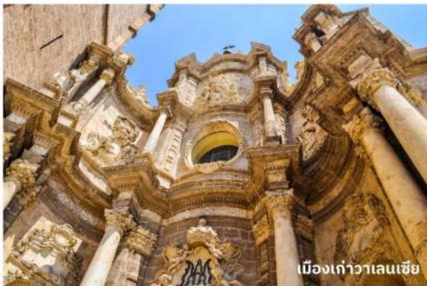
เมืองเก่าวาเลนเซีย