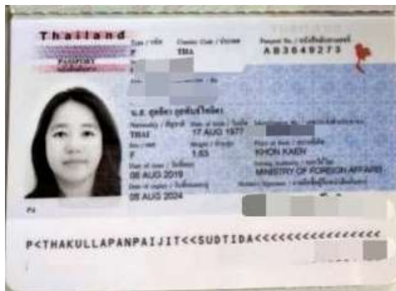
ตัวอย่าง หน้าพาส ยื่น VISA EGYPT