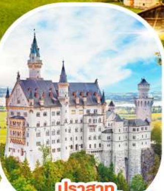
ปราสาท นอยชวานชไตน์