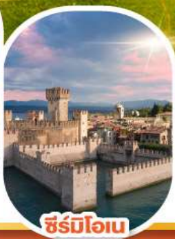
ซิริมิโอเน