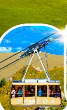
กระเช้าเซเคด้า