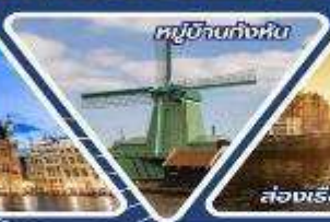
หมู่บ้านกังหัน