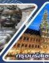
กรุงบรัสเซล