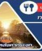
ส่งเรือหลังคากระจก