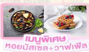
เมนูพิเศษ หอยมัสเซล+วาฟเฟิล