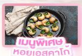
เมนูพิเศษ หอยออสตาโก้

เยอรมัน เนเธอร์แลนด์ เบลเยียม ฝรั่งเศส Keukenhof