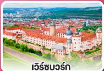
เว็ร์ซบวร์ค