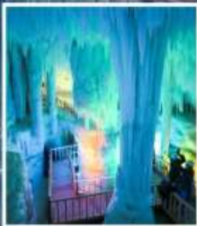
ถ้ำน้ำแข็งอวิ้นฮิวซาน