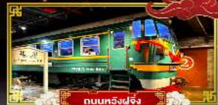
ถนนทวิงฟูเจิง