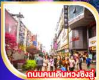
ถนนคนเดินหวงชิ่งอู่