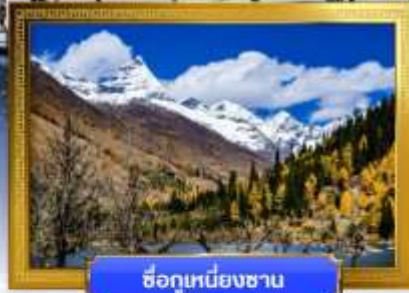
ชื่อภูเขาหิมะชาน