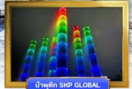
น้ำพุตึก SKP GLOBAL