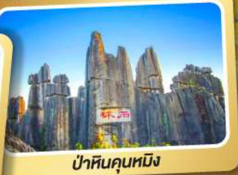
ป่าหินคุณหมิง