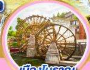
เมืองโบราณ ลี่เจียง