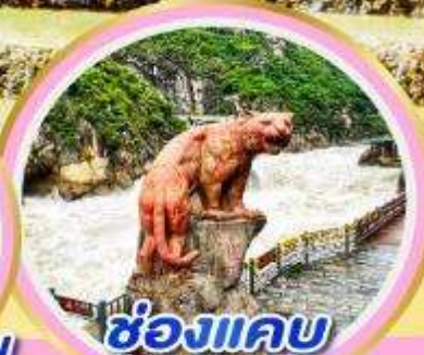
ช่องแคบ เสือกระโจน