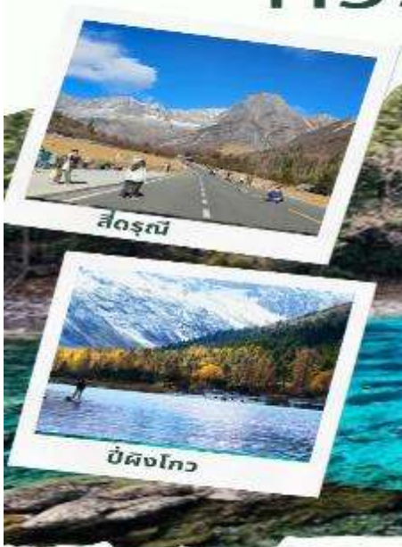
สี่ดรุณี