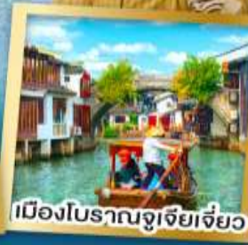
เมืองโบราณจู่เจียเจี้ยว