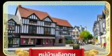
หมู่บ้านอังกฤษ