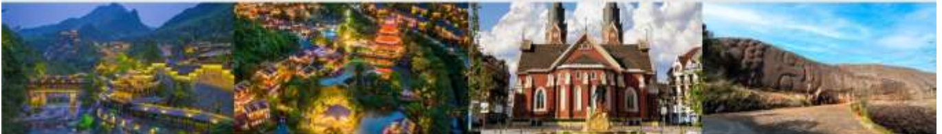
หุบเขาเทวดาวังเซียนกู่