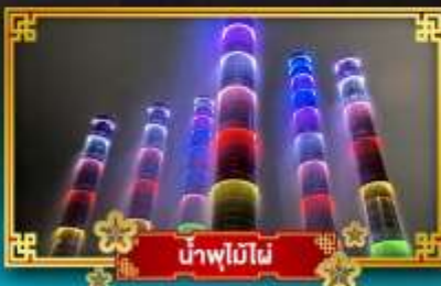
น้ำพุไม๊ผៃ