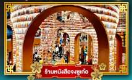
ร้านหนังสือจงชว่น