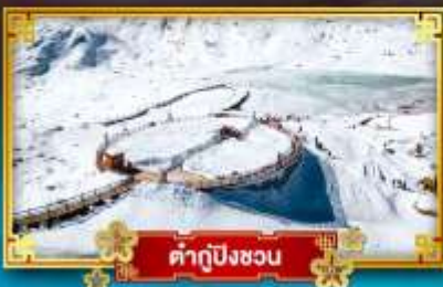
คำกู่ปิงชว่น