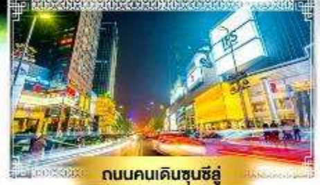
ถนนคนเดินชุนซีอู่