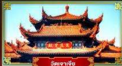
วัดเจาเจีย