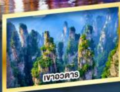
เขาอวตาร