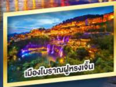
เมืองโบราณผู่หลงเจิ้น