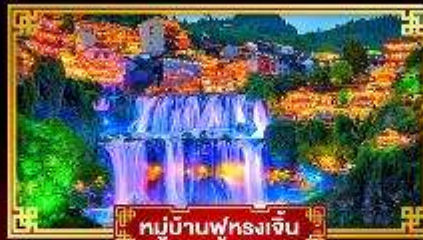
หมู่บ้านฟุรงเจิน