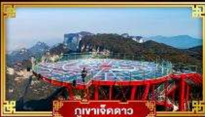
กุเขาเจ็ดดาว