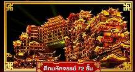
ตึกมหัศจรรย์ 72 ชั้น