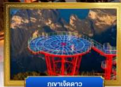
กุเวาเจ็ดดาว