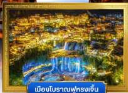
เมืองโบราณฟูหลงเจิ้น