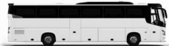
ตัวรถปรับอากาศ 1 ชั้น

ค่าที่พักตามที่ระบุในรายการหรือเทียบเท่าระดับเดียวกับ (พิกห้องละ 2 ท่าน) หากประเภทห้องที่ท่านริเวสณาเดิม อาทิ เช่น ริเวสลาห้องพักเป็น TWIN BED หรือ DOUBLE BED ทางบริษัทขอสงวนสิทธิ์ในการปรับประเภทห้องพัก เป็น ตามที่โรงแรมมีอยู่ โดยไม่ต้องแจ้งให้ทราบล่วงหน้า