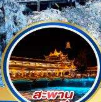
สะพาน หนานเฉียว